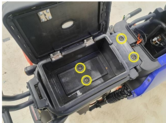
Avaa takapenkki ja irrota takapenkin kiinnityspultit (kuusiokoloavain 5 mm).