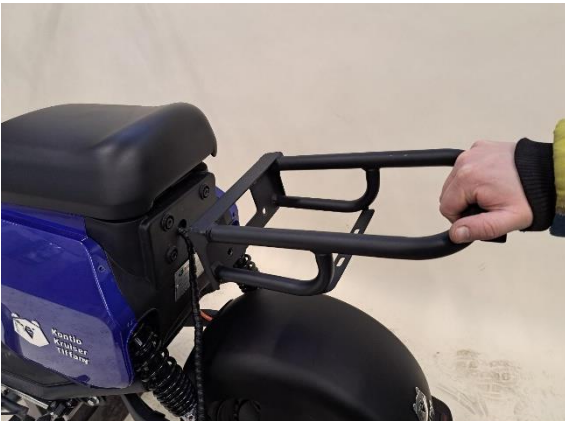
Ota takaistuimen tavaratilan kiinnike pois.

Uuden osan asennus käänteisessä järjestyksessä.