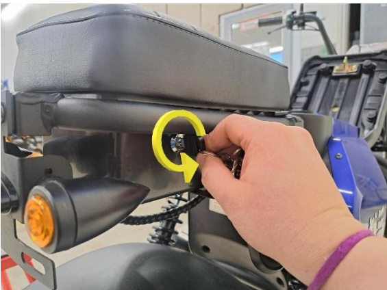
Avaa takapenkin lukitus.