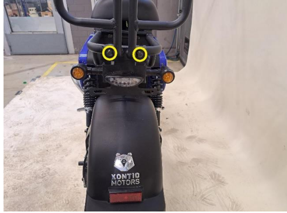
Irrota takaistuimen selkänojan ja takavalon kiinnityspultit (kiintoavain 10 mm).