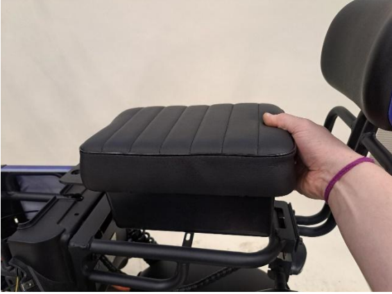
Ota takapenkki pois.