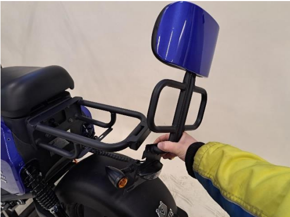
Ota takaistuin ja takavallo pois.